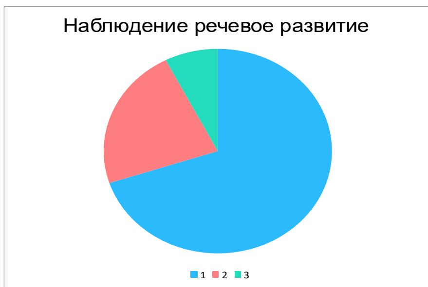
Таблица «Сравнительный анализ по критериям сформированности речевого развития (по группе) В целом по группе, %